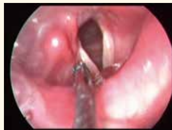
▲圖3：在局部麻醉下施打玻尿酸治療聲帶麻痺