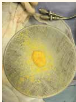
▲圖1：從腹部抽取的自體脂肪