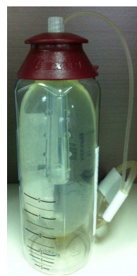
圖一 裝滿藥物，儲藥囊呈充滿狀

■充滿的儲藥囊會隨輸注時間增加而變輕變小，當儲液囊縮小至呈一長條時且兩旁的顆粒突起，表示藥物已滴完畢(圖一、二)，即可返回醫院移除。