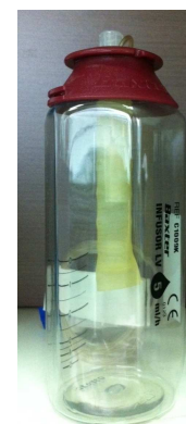
圖二 藥物滴完，儲藥囊成一長條且兩旁的顆粒突起