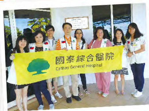
國泰綜合醫院醫療團於Labasa Hospital前合影