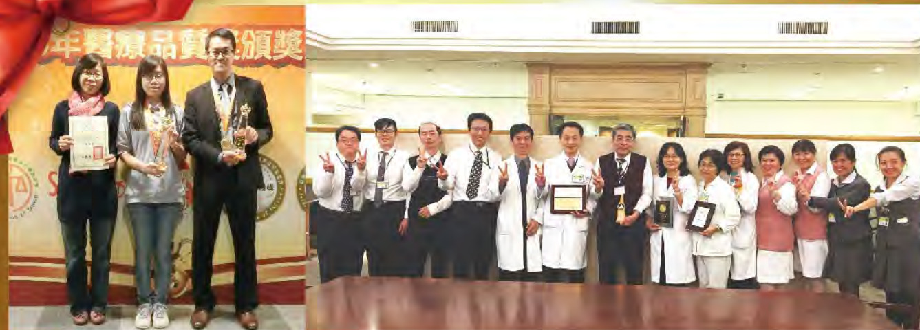
圖1 醫策會醫療品質獎擬真情境類獲獎團隊代表

版權所有，非經本刊及作者同意，不得作任何形式之轉載 或複製如對刊物內容有任何疑問， 請洽02-27082121 分機1322