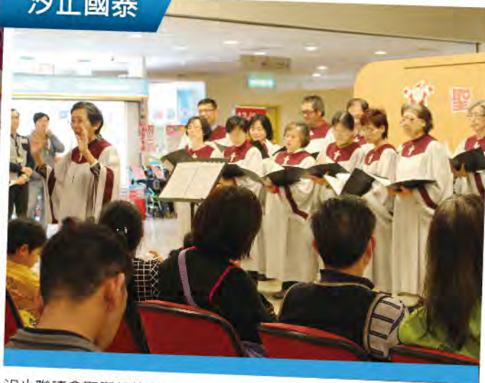
汐止聯禱會聖誕報佳音。