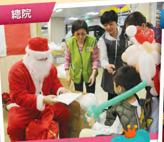
聖誕老公公發放禮物及棉花糖。