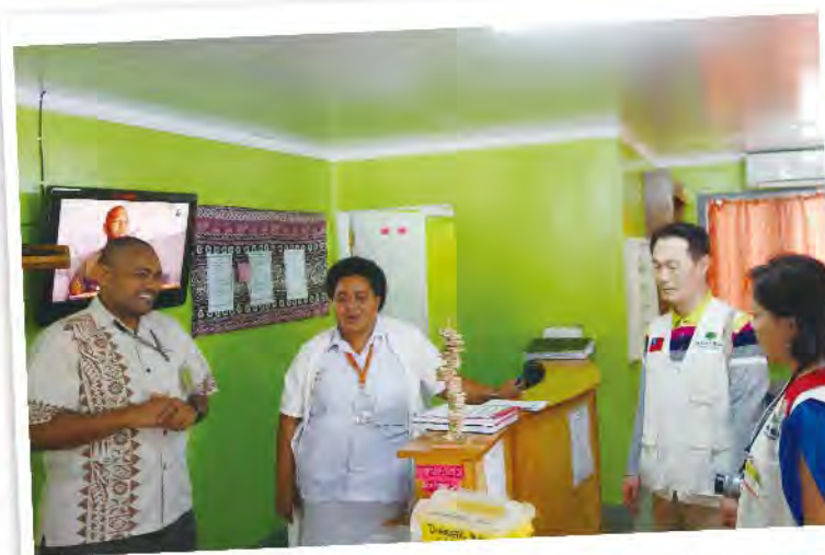
國泰綜合醫院醫療團參觀糖尿病中心

然而令人不忍的是，由斐濟Labasa醫院高層的口中我們得知，目前斐濟政府完全承認過去50年斐濟的糖尿病治療是全然失敗的，當前他們只能做如上述案例所呈現的亡羊補牢的醫療工作。如今斐濟政府則決心投注所有心力與資源，由幼童的教育著手，徹底改造斐濟人的飲食及生活習慣，希望50年後能完全扭轉當前斐濟糖尿病照護的劣勢。聽完他們上述的說詞，我們欣慰斐濟政府終於抓準糖尿病防治的方向，但另一方面不禁要感嘆，身為第一線照顧糖尿病人醫療人員的我們，以及眼前這些糖尿病人，我們到底還有多少個50年？