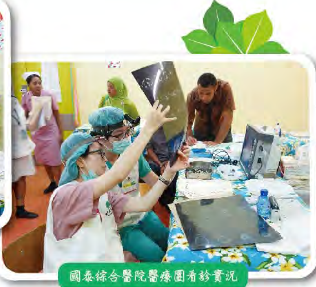
國泰綜合醫院醫療團看診實況