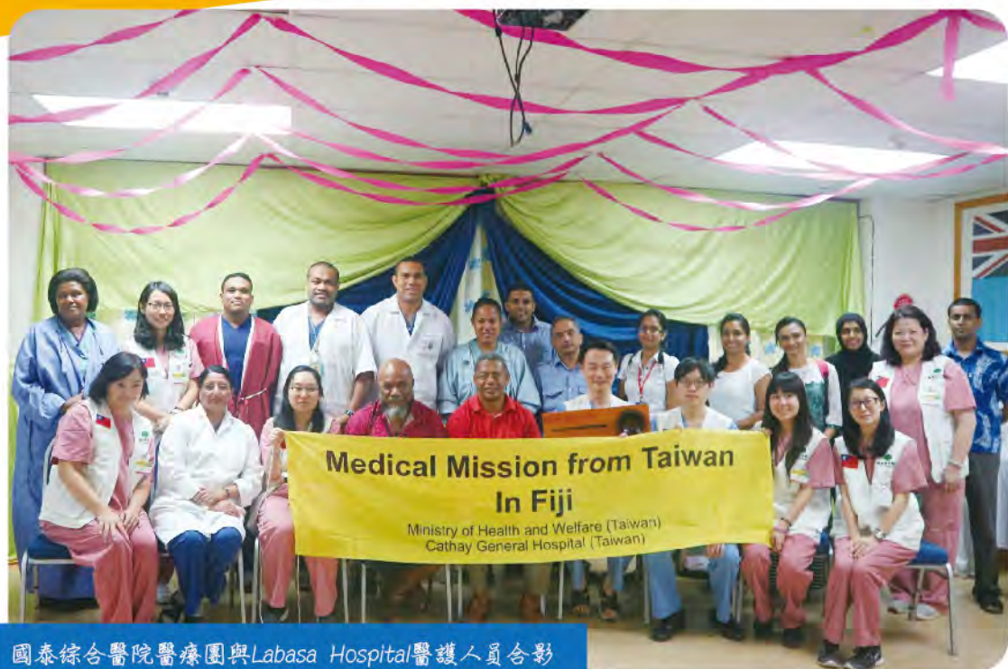
國泰綜合醫院醫療團與Labasa Hospital醫護人員合影