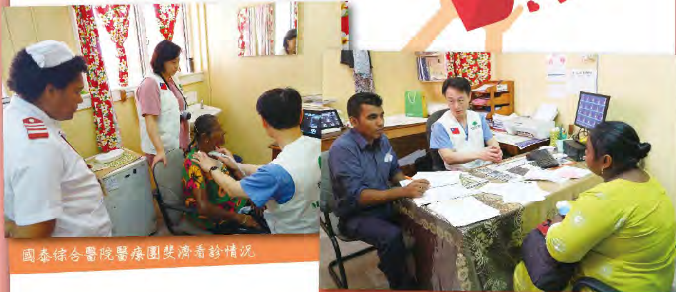
國泰綜合醫院醫療團斐濟看診情況