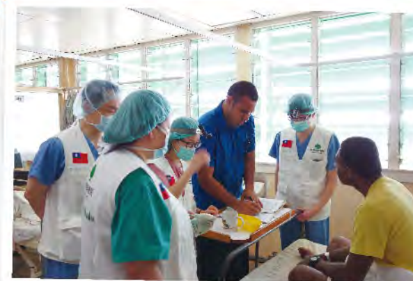
國泰綜合醫院醫療團協助 Labasa Hospital 提供多科會診及教學

服務期間令人印象深刻的是，當地護士在處理糖尿病人清創後足部傷口，竟以「蜂蜜+優碘」做為足部傷口敷料。經醫療團進行文獻查證發現，據少數文獻，蜂蜜雖具有助傷口癒合效用，但這樣的做法仍要小心傷口感染問題，這類案例若在台灣一般由整形外科植皮，或塗抹優碘軟膏治療。