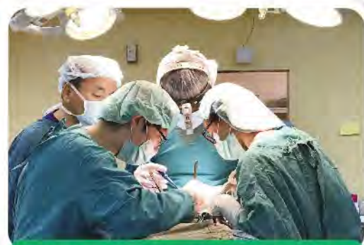
國泰綜合醫院醫療團執行耳鼻喉科手術

工作的第一天，我們耳鼻喉科共診治了40餘名轉介來的門診病患，並在隨後的幾天手術日內，完成了13例全身麻醉手術及3例局部麻醉手術。因為經過篩選，我們所看到的，大多是主訴鼻塞、扁桃腺發炎、或是聽力不好的案例。而鼻塞中，以鼻息肉居多，鼻中膈彎曲和鼻炎也有若干案例。扁桃腺發炎的病患，大多是主訴一年中多次反覆發炎，造成生活上相當的困擾；只有一例中年女性是合併肥胖和第四級扁桃腺肥大，疑似睡眠呼吸中止症的案例，我們也為她進行了懸雍垂顎咽成形手術。而聽力不好的案例，大多是耳垢填塞，但也有小朋友因長期中耳積液造成耳膜塌陷的案例，這在台灣比較少，因為小朋友都會有