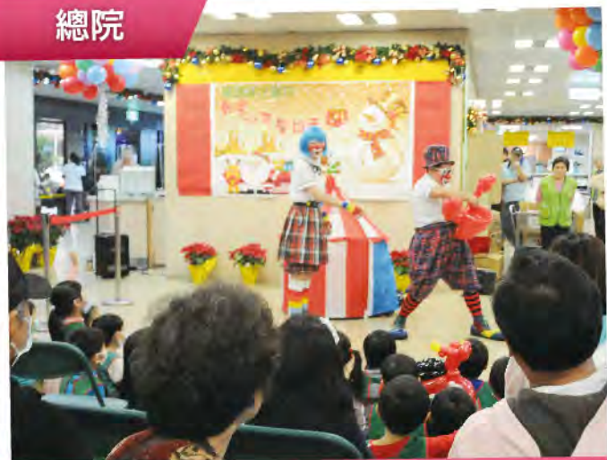
小丑劇團表演精采的經典小丑劇