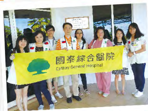
國泰綜合醫院醫療團於Labasa Hospital前合影