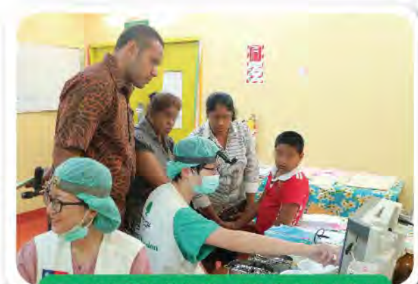
國泰綜合醫院醫療團至斐濟醫療服務實況

而我，只是一個說故事的人，但在那個時刻，我卻什麼話也不想說。電影《白日夢冒險王》有一幕，當班史提勒所飾演的華特，跋涉過千山萬水終於在喜馬拉雅山上找到攝影師「尚」時，尚說：「當那最美好的時刻發生時，我不按快門，只享受那個時刻。」