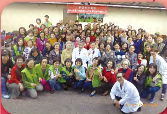
國泰綜合醫院舉辦「愛心服務團志工年會暨20週年慶祝大會」，長官及貴賓與當日參與志工合影