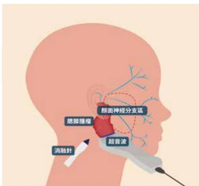
▲圖三 經皮超音波導引消融治療腮腺腫瘤

腮腺腫瘤最常見的是好發於四十歲以下女性的多形性腺瘤(或稱混合瘤)(pleomorphic adenoma)，此類腫瘤雖占腮腺良性腫瘤的百分之八十，但研究指出若遲遲不處理，會在約十五年後有較大機率病變成惡性腫瘤。第二常見的則是好發於中老年男性及長年抽菸者、BMI 指數偏高或代謝症候群患者的華生氏腫瘤(Warthin's tumor)，這類腫瘤發生惡性病變的機率非常低，通常不必擔心遠端轉移或深層侵犯的問題，所以可以採用新式的腫瘤消融技術治療。經皮超音波導引消融治療是藉超音波導引將消融針伸入腫瘤，利用交流電原理在針尖形成電迴路後產生離子擾動，再將其動能轉化成熱能，以 70 度溫度破壞腫瘤，讓它被身體慢慢吸收，手術時間約 30-50 分鐘，而且術後沒有傷口。之前此技術多運用在甲狀腺結節，目前也逐漸應用在其他部位良性特定軟組織腫瘤上。