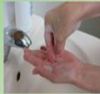
7. 指尖對掌心搓揉，再兩手交替