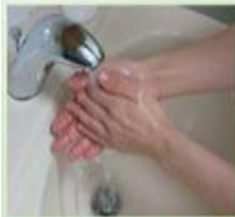
1. 以清水及洗手乳抹在手上