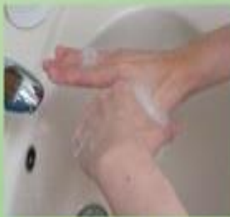
6. 虎口對拇指搓揉，再兩手交替