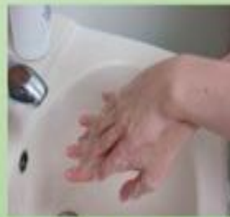
3. 掌心搓揉手背，再兩手交替