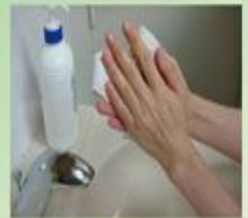
8. 用水沖洗後擦乾雙手，雙手位置須高於手肘