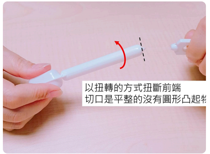
04. 將前端的塑膠頭扭轉下來