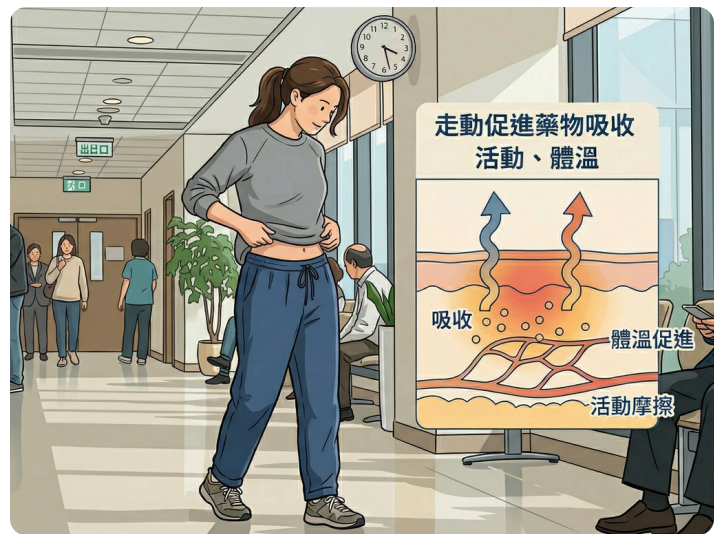
06. 塞完快孕隆後建議可以走動透過活動摩擦、體溫，促進藥物吸收