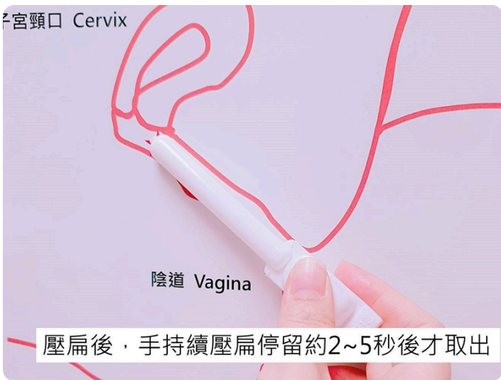
05. 輕輕地將給藥器的細端放入陰道中，壓扁後端空氣囊使藥劑進入陰道內，不鬆開持續壓扁停留約2~5秒後取出，待完全取出陰道後才鬆開空氣囊