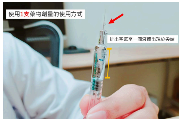
使用 1支 藥物劑量的使用方式

0.5 半支劑量施打，水平拔開針蓋，使用雙手握住針筒推桿先下拉後再慢慢上推排出0.5支劑量