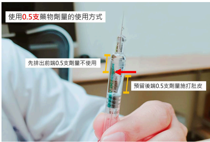
使用 0.5支 藥物劑量的使用方式