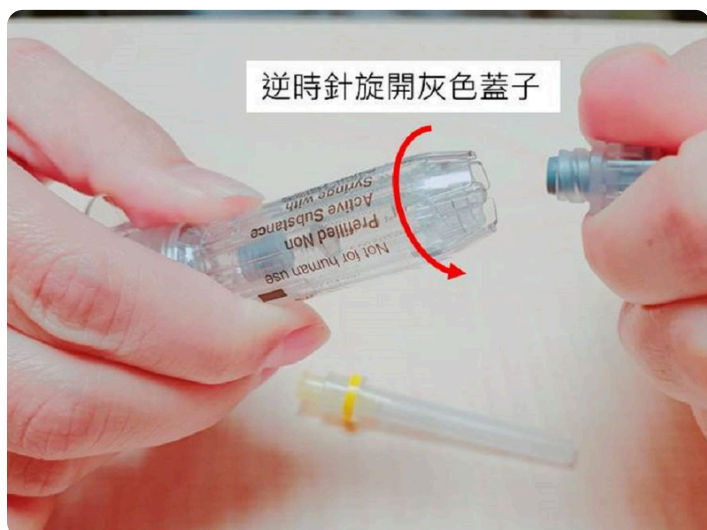
01. 逆時針旋開針筒上灰色保護蓋