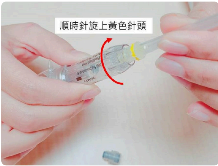
03. 順時針旋上黃色針頭