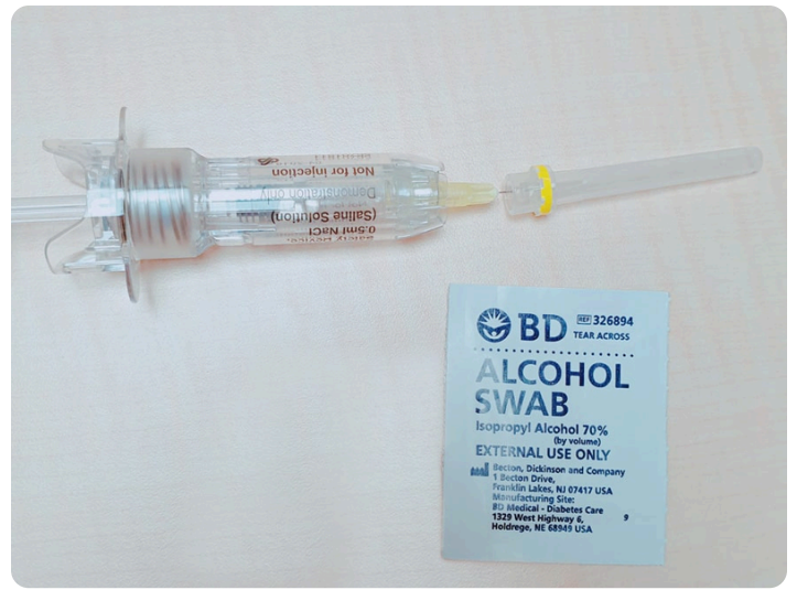
04. 將針尖輕輕蓋上蓋子，平放於桌面上，並準備酒精棉片