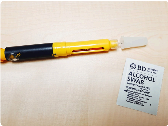
09. 將針尖輕輕蓋上蓋子，平放於桌面上，並準備酒精棉片