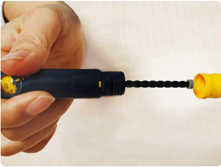
03. 將筆針注射器組合在一起並旋緊對齊圖示(三角形對準長方形)