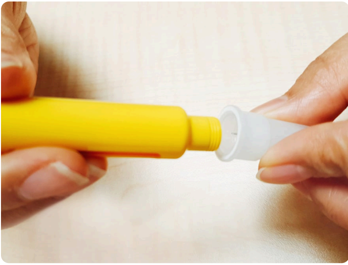
07. 剝除針頭紙膠膜，將筆針正中央對準針頭，並以螺旋旋轉方式拴緊