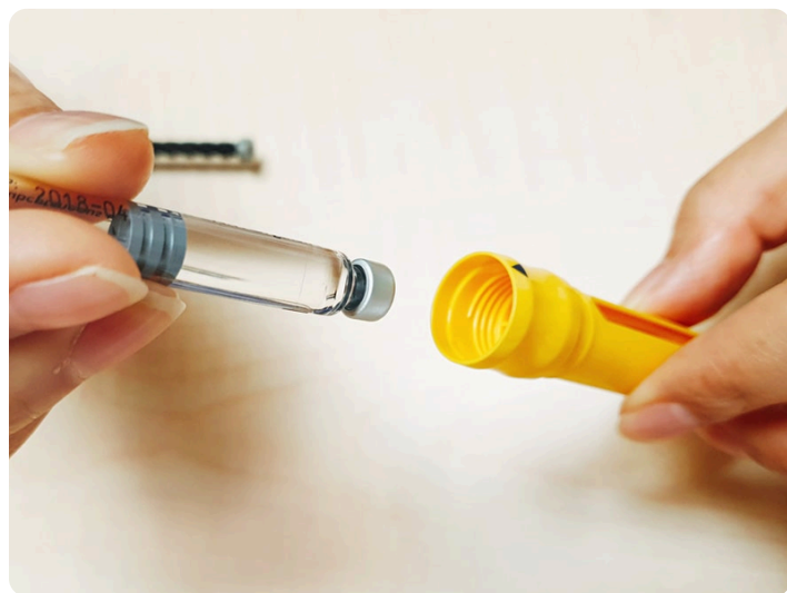
02. 將藥品匣取出鋁頭朝下放入黃色注射器內