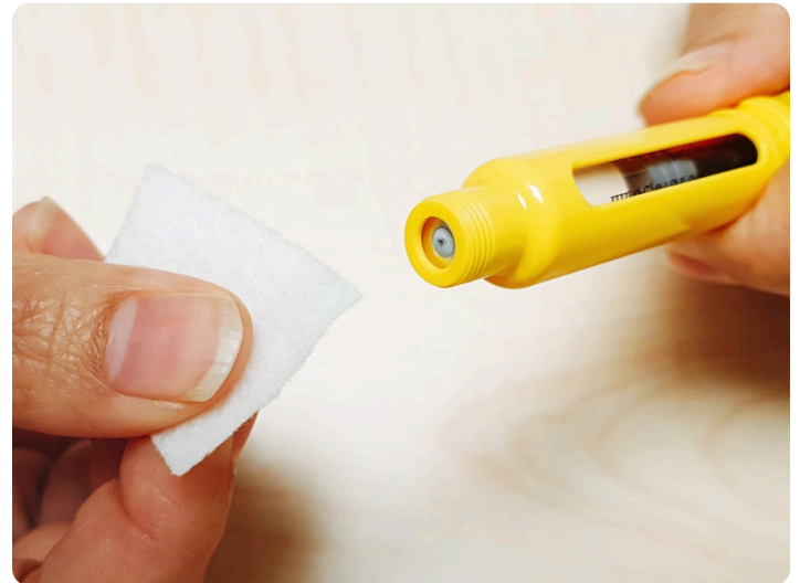
06. 拔開注射針筆蓋，使用酒精棉片消毒筆針前端橡皮頭