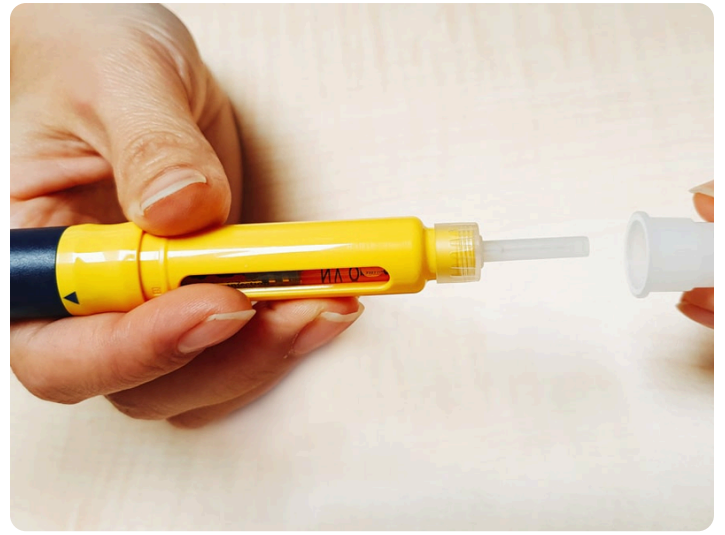
08. 拔開針頭蓋子及保護內蓋