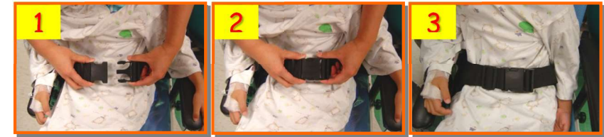
附註：感謝以上可愛的小模特兒及其家長的示範，讓我們的住院環境更加安全