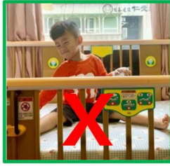
床欄半拉不好安全