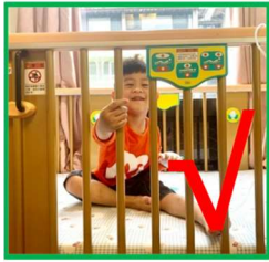
床欄拉高卡好最安全