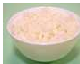
1 碗飯（160 克）