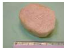
山藥 1/2 碗 (80 克)