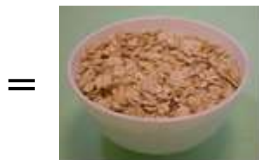
1 碗麥片 (80 克)