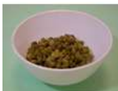
綠豆 1/3 碗 (50 克)