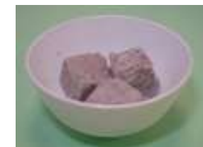
芋頭 3 塊 (55 克)