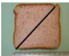
薄吐司 1/2 片 (30 克)