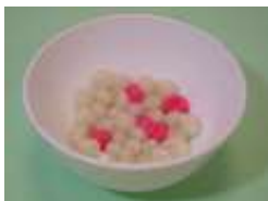
湯圓 1/4 碗 (30 克)