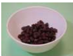
紅豆 1/3 碗 (50 克)