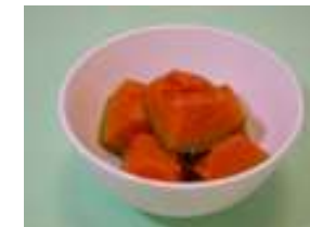
南瓜 1/2 碗 (85 克)