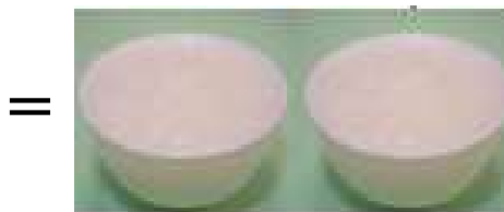
2 碗稀飯（500 克）