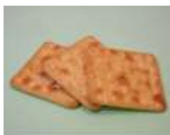
蘇打餅乾 3 片 (20 克)