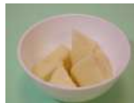
馬鈴薯 6 塊 (90 克)