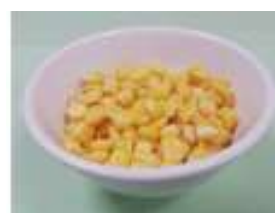
玉米粒 1/2 碗 (85 克)