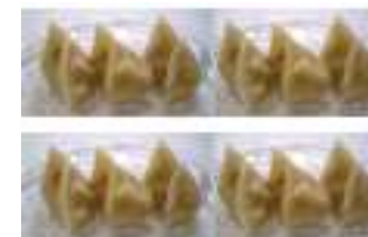
12 個水餃（120 克） （不含餡料）