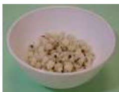
薏仁 1/3 碗 (60 克)