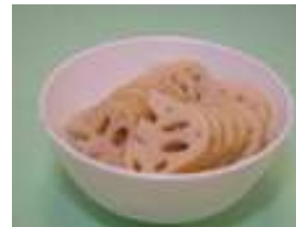
蓮藕 2/3 碗 (100 克)