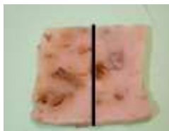
早餐店的蘿蔔糕半片 (50 克)