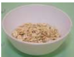
1/4 碗麥片 (20 克)