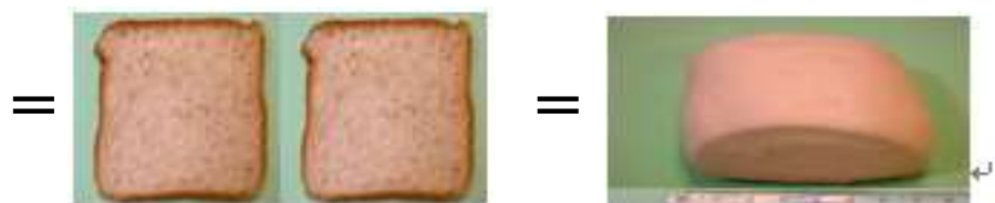
2 片薄土司 (120 克)