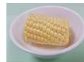
玉米 1/3 根 (110 克)