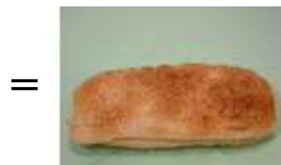
1 個燒餅 (80 克) (加 10 克油)