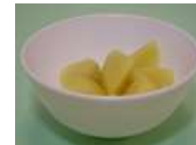
地瓜 1/2 碗 (55 克)