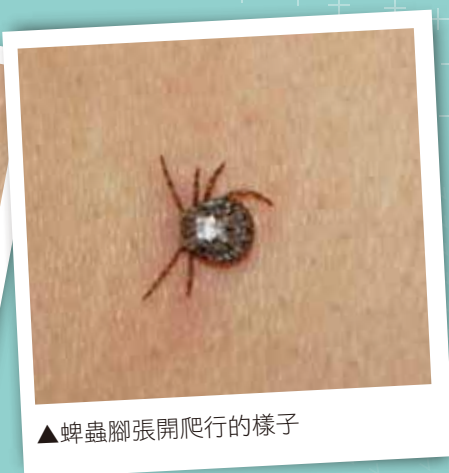
▲蜱蟲腳張開爬行的樣子